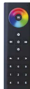
Mando para control RGBW portátil inalámbrico por radiofrecuencia. RGBW controller portable wireless by Radio Frequency.