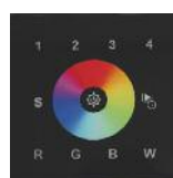
Mando de control RGBW empotrable de pared por DMX. RGBW Controller, Wall recessed by DMX.